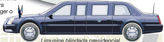
Limusine blindada presidencial

Arquibancada: recebe mil pessoas, incluindo coros e convidados