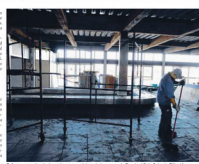
Um trabalhador em uma das áreas de construção do terminal de passageiros do aeroporto de São Paulo

A ampliação planejada para o Aeroporto de São Paulo, com o novo terminal de passageiros, o antigo terminal de passageiros será reativado para voos regionais e nacionais, o que impede em 2014 a conclusão de outras obras. O projeto prevê a construção de um novo terminal de passageiros com capacidade para 10 milhões de passageiros por ano, além da ampliação da pista e da construção de um novo terminal de cargas.